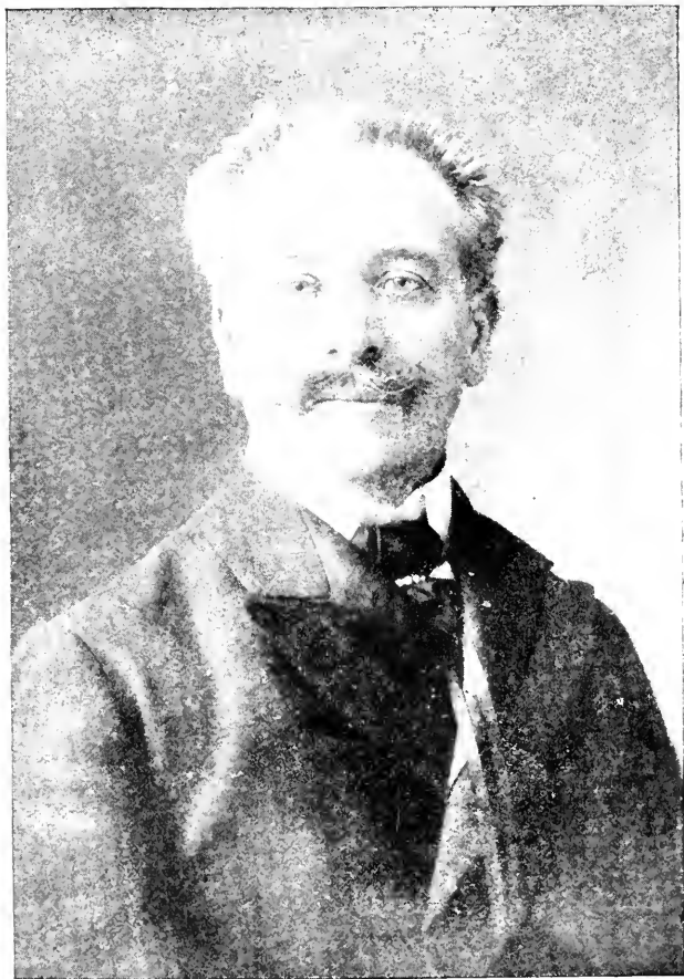
VIE G. D'AVENEL.